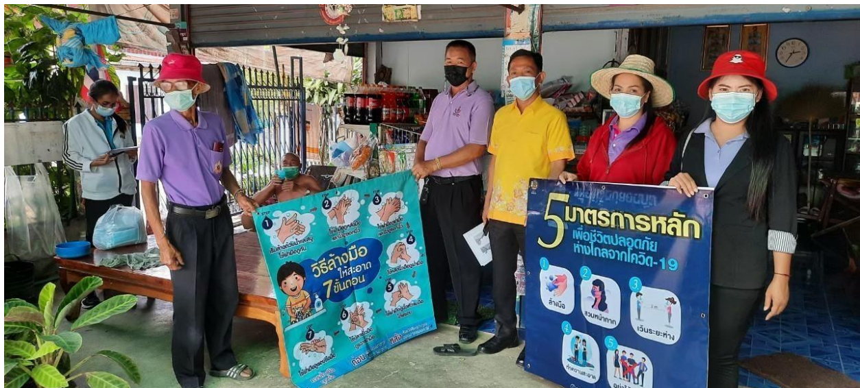
ภาพที่ 5.6 กิจกรรม/โครงการขององค์การบริหารส่วนตำบลห้วยเตย อำเภอชำสูง (5)