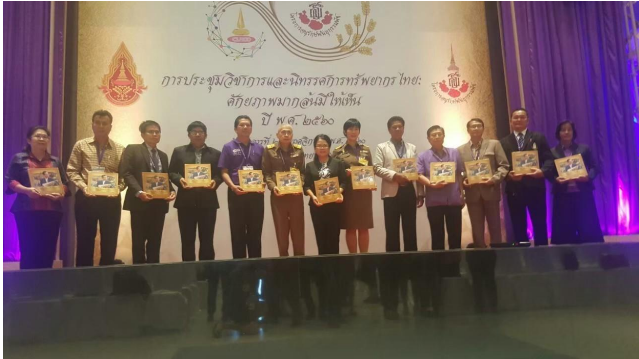
ภาพที่ 5.2 กิจกรรม/โครงการขององค์การบริหารส่วนตำบลห้วยเตย อำเภอชำสูง (2)